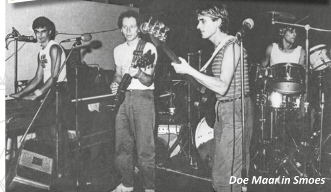
Doe Maar in Smoes